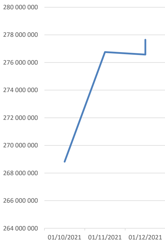
Evolution de l'actif Net